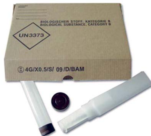
Die abgebildete Kennzeichnung gemäß 6.0.4 IATA-DGR ist ein Beispiel für den Nachweis der Bauartprüfung einer kistenförmigen Verpackung aus Pappe (andere Materialien gemäß IATA-DGR möglich) mit einer Bruttomaximale Masse von 0,5 kg.